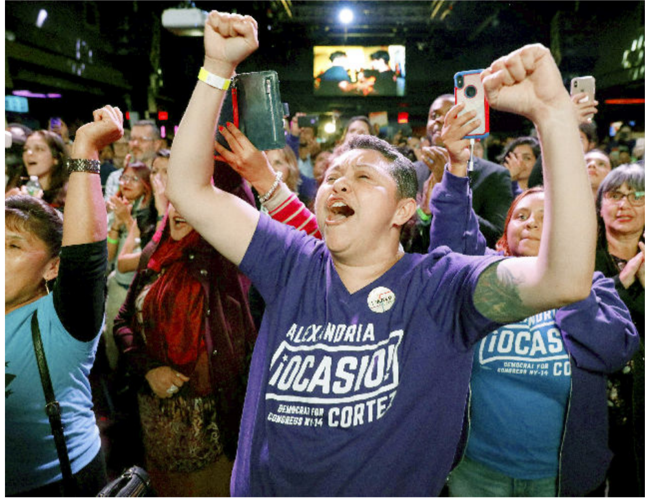
6日、米中間選挙で民主党の下院選候補オカシオコル テス氏の当選が確実となり、喜びに沸く支持者たち （ニューヨーク（ロイター）共同）

【ワシントン共同】米中間選挙は6日投票 票が行われ、トランプ大統領と対立する野党 民主党が下院で8年ぶりに多数派を奪還し た。有権者は政権に厳しい審判を下した。上 院は共和党が多数派を維持した。米主要メデ ィアが伝えた。ねじれ議会で党派対立が一層 激化し、政局が緊迫するのは必至で、トラン プ氏が掲げる「米国第一」の公約実現は困難 になりそうだ。