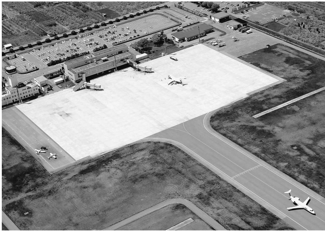
東日本大震災では大きな役割を担った山形空港＝東根市